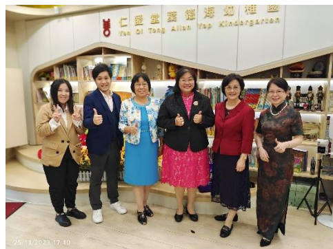
順道參觀仁愛堂葉德海幼稚園