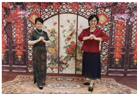
現場設置中式背幕給參加者拍照