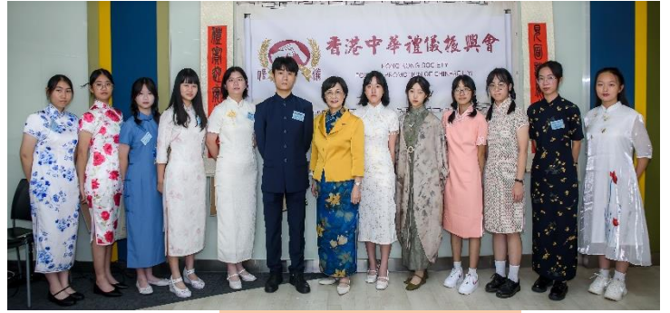
高中組獲獎學生合照