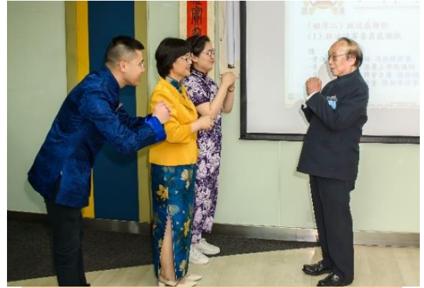
致送感謝狀前，各人互相行禮