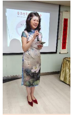
黎雅麗副主席 致謝辭