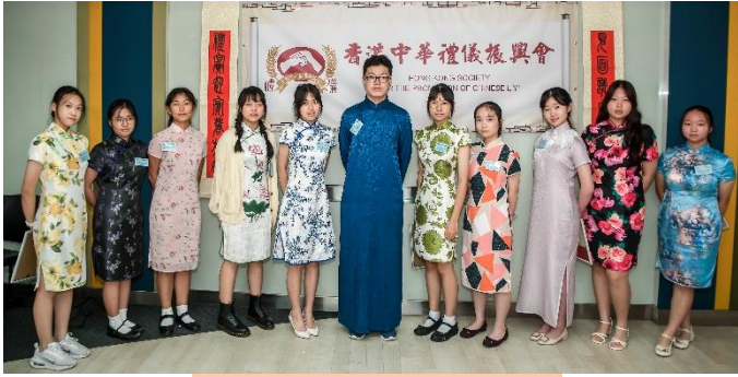
初中組獲獎學生合照