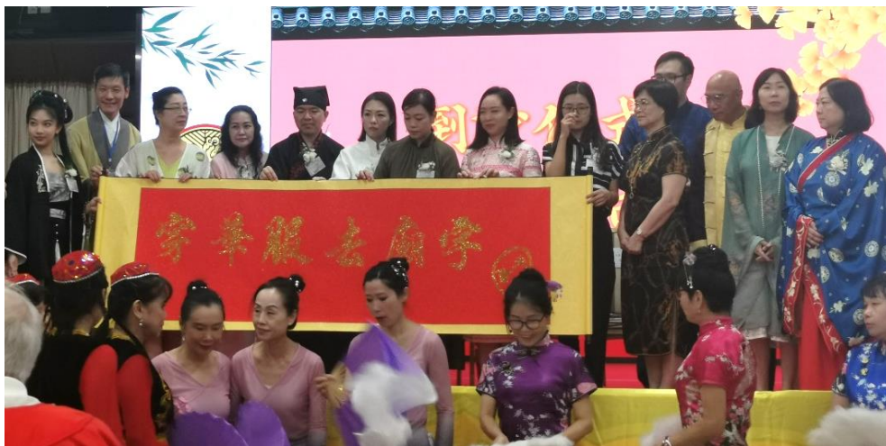
主禮嘉賓灑金粉儀式，呈現活動主題「穿華服 去廟宇」