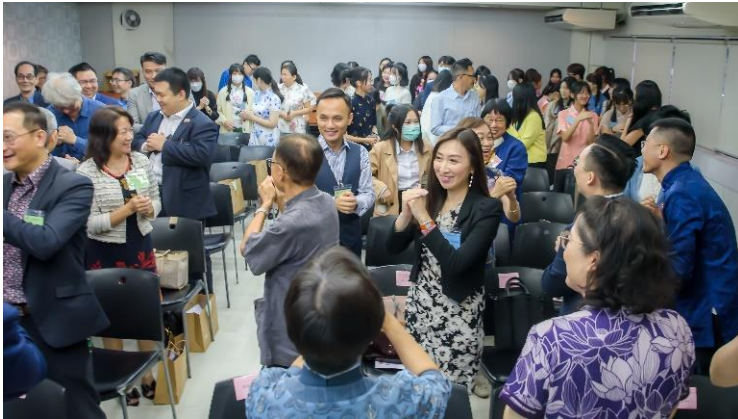
全場來賓互相拱手問候