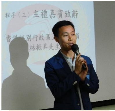
主禮嘉賓 立法會議員 林振昇先生 致辭