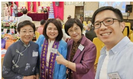
東井圓暨美燕主席(左2)