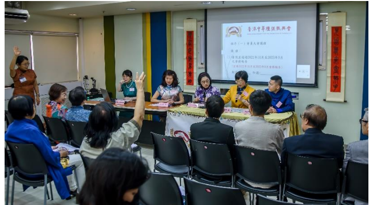
會員們舉手動議、和議通過各議項