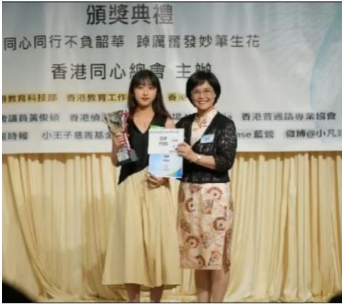
楊主席頒發公開組亞軍