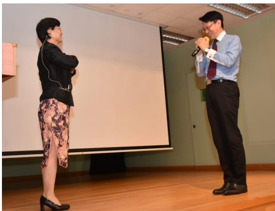
黃錦耀校長(右)以禮相迎