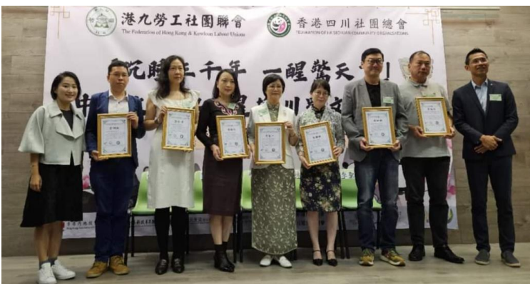
各協辦機構代表接受感謝狀