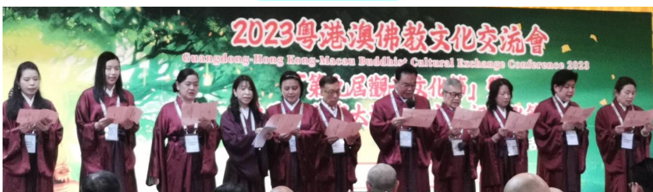
孔教領袖齊讀宣言