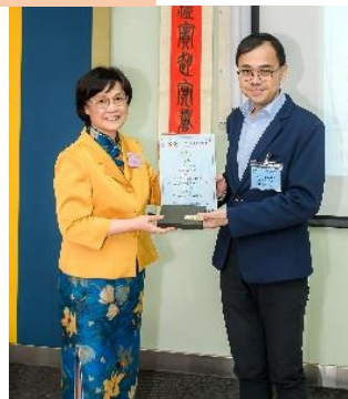
立法會議員 黃俊碩先生 接受