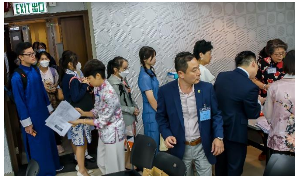
嘉賓、領獎生魚貫進場