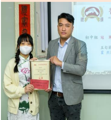
冠軍 五旬節聖潔會 永光書院 霍然同學