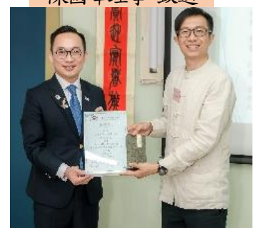
香港匯賢扶輪社 周博社長(左) 接受