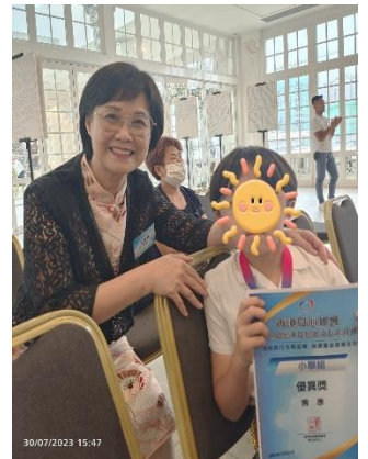
楊主席巧遇曾教過的學生領獎