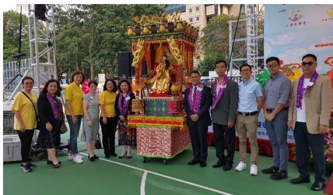
為濟公轎簷花戴紅