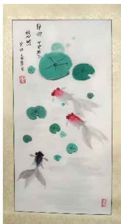
楊主席獲贈國畫《悠然》及畫冊